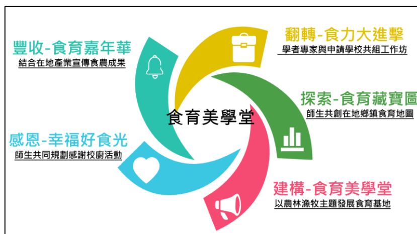
圖 2 本縣食育美學堂概念圖

(五)豐收—食育嘉年華：補助 50 餘所國中、國小於食農成果嘉年華、花在彰化及 2022 中農博等大型活動展現食農教育成果，共有 600 位師生及 5,000 位縣民參與。