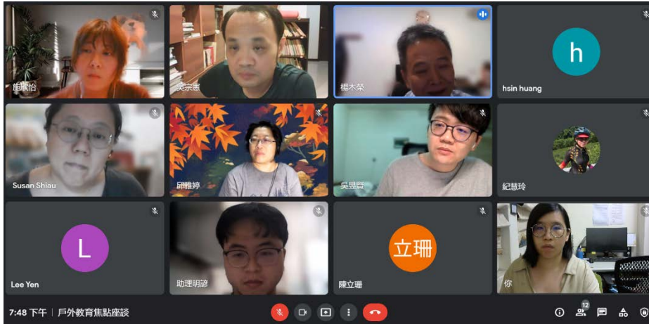
圖 3 焦點座談會合照