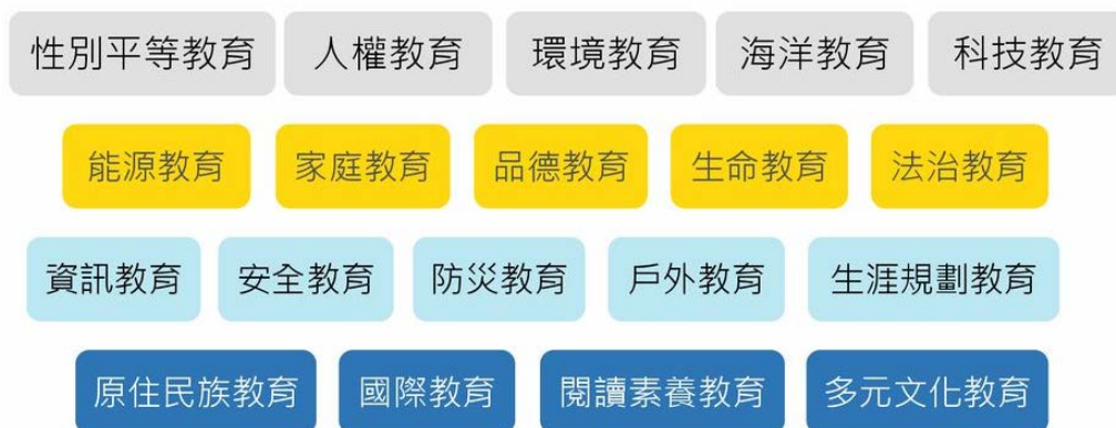
圖 1 十二年課綱規劃之 19 大議題。

「戶外教育」納入十二年課綱的 19 大議題中。（關於詳細 19 大議題介紹以及融入方式，可見由國教院編撰的 十二年國民基本教育課程綱要 ，或由研究團隊彙整的 閱讀筆記心智圖 ）