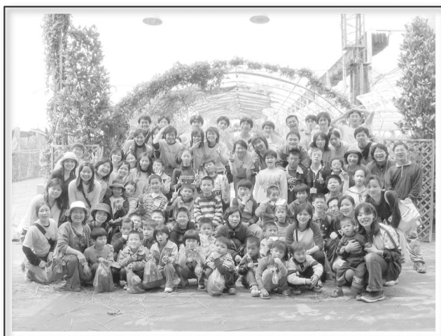
靜修小天使農場體驗2004