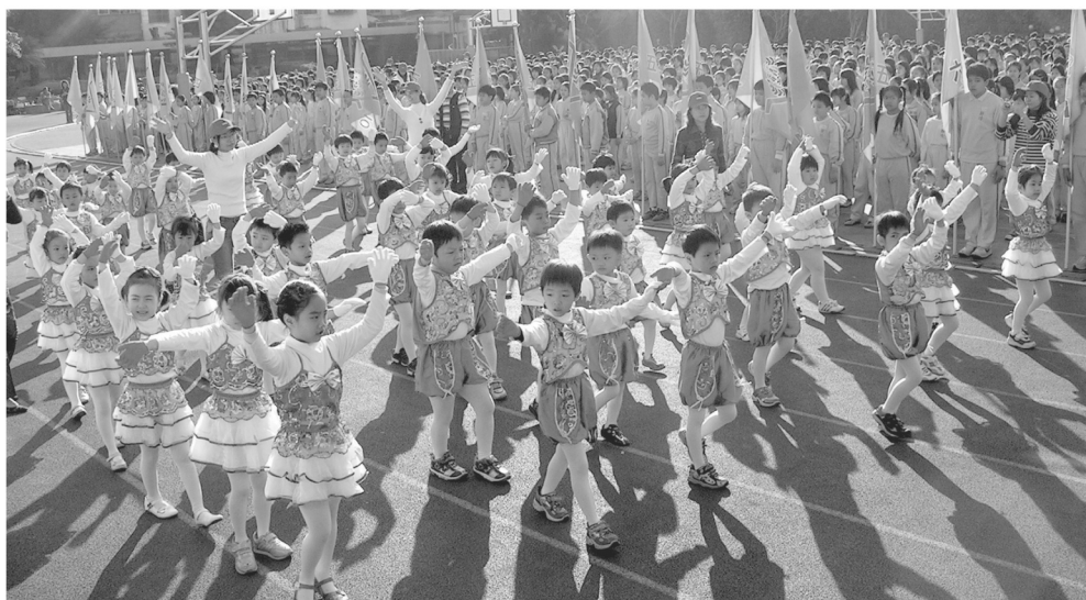
靜修附幼運動會出場2006.12

靜修幼稚園多年來已成為本縣重要的幼教重心，每年舉辦全縣性幼教師研習，多年來累積許多優良事蹟，校友表現相當優秀。我們以幼童為本位，重視個別差異，在自由開放的環境下，引導孩子探索興趣，開發多元智慧潛能，讓孩子在歡樂的學習環境中健康成長，在團體互動中學習人際關係與團隊合作能力，在全人教育下培養樂觀進取的生活態度，未來我們將秉持優良的教育學風，為教育國家幼苗努力，歡迎大家走入靜修幼稚學園，與我們結緣。