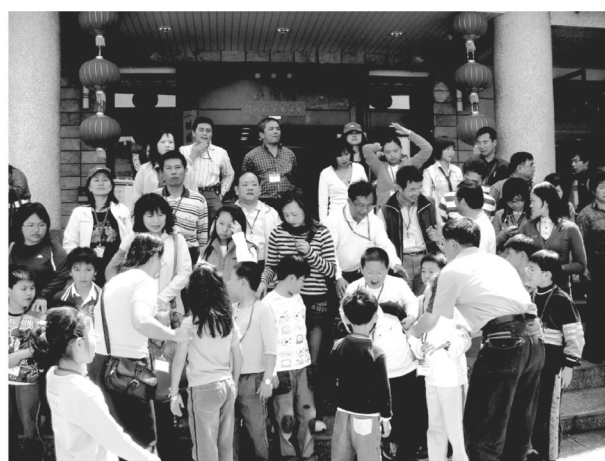
家長會親子阿里山之旅2008.04