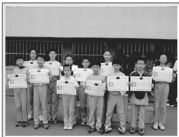
靜修小天使參加全縣田徑賽獲獎連連2004