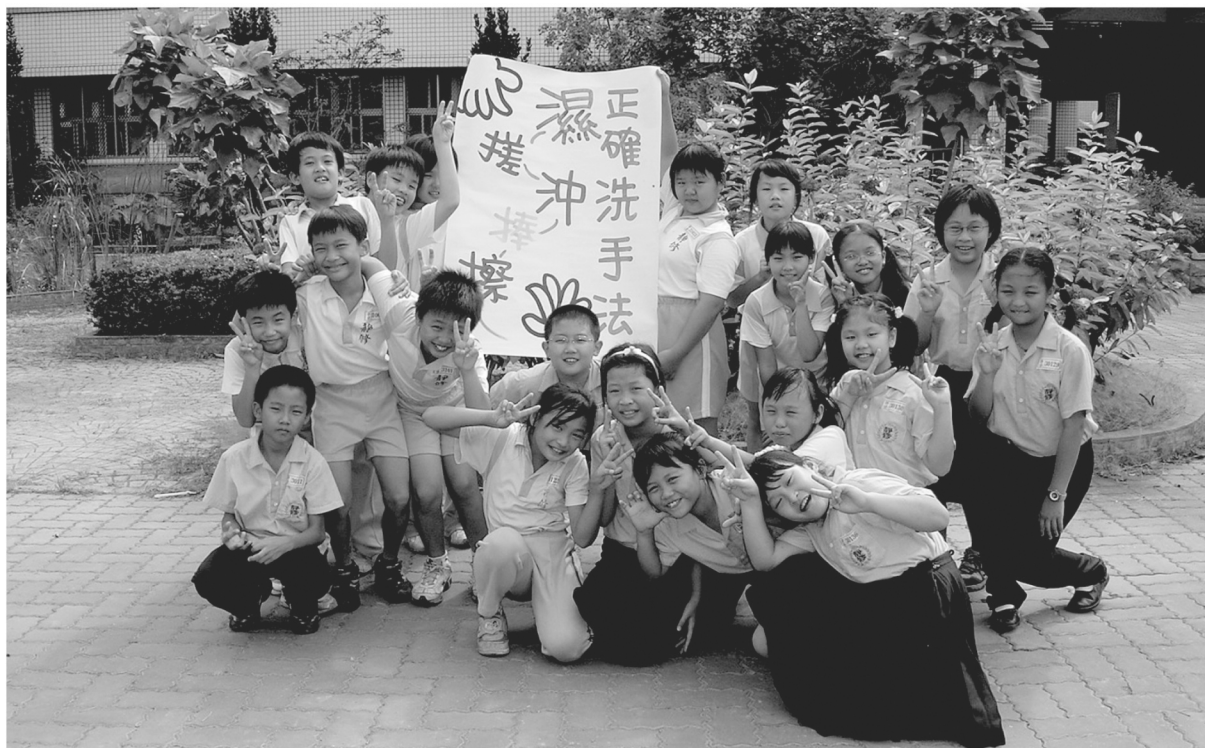
洗手小天使宣導合照2007.10

健康中心成立至今，經過靜修人辛勤耕耘，儼然已成為師生身心靈保健的守護站，我們將秉持老吾老以及人之老，幼吾幼以及人之幼的高尚胸懷，盡全力而為，為靜修人提供優質健康的衛教環境。