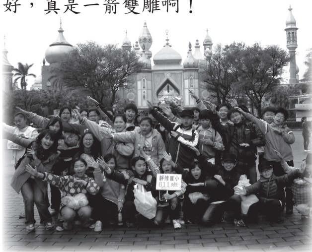
六年十一班有趣的畢業旅行

雖然我在鎮運、縣運、聯運得到好成績，但是我還有很多挑戰，現在上田徑練習時，一定要把學弟妹帶好，把學姐的精神傳承下去，這樣才不辜負田徑隊老師。我一定會把握每一分每一秒，一邊幫助自己體能不退化，一邊把學弟妹帶好，真是一箭雙雕啊！