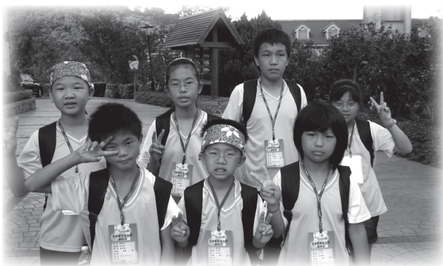
六年十二班難忘的夏令營

寫完這篇作文時，我發現自己的問題真的很多，還得多多檢討自己的行為舉止，學會勇於接納別人，站在別人的立場想，這樣人緣一定會愈來愈好。