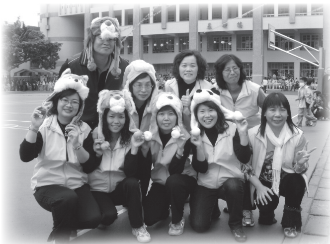
我們都是靜修快樂小天使

我要感謝靜修國小給我們聽障生這麼好的環境讀書，更希望啟聰班能一直持續下去，讓未來有需要讀啟聰班的小朋友，都能來靜修讀書，成為靜修一份子。