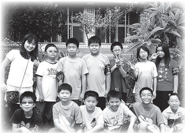
我們是快樂的環保小義工

媽媽在家庭成員中，扮演相當重要角色。如果我是媽媽的話，一定會當盡責的好媽媽，把我的小孩照顧得無微不至。