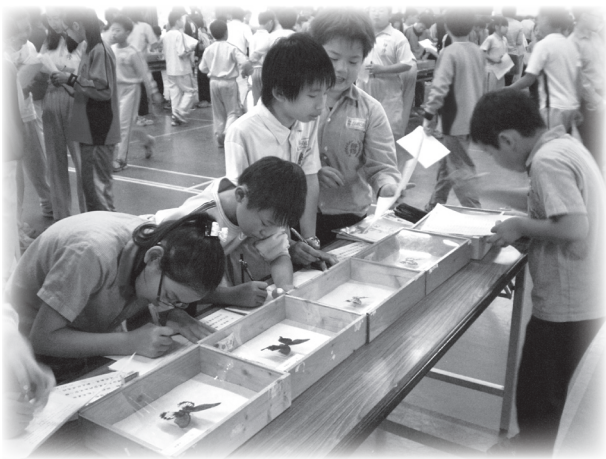
八卦山昆蟲巡迴展

中午肚子餓了好久，走到廚房看到阿嬤，拿著鏟子在鍋子前大展身手，一會兒中餐終於大功告成。望眼過去，哇！五顏六色的料理，一下子紅、一下子綠、一下子黃，真是美味。拿起筷子吃得好滿足喔！我最愛吃阿嬤的菜，更愛阿嬤。