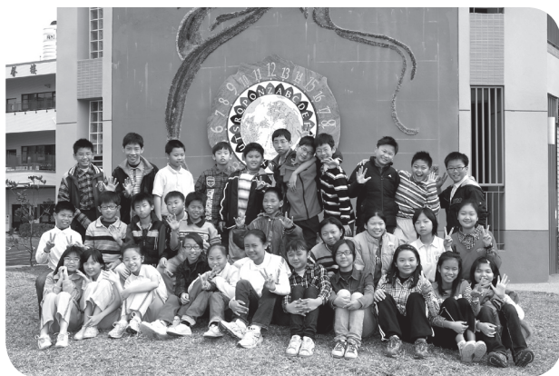
六年九班友誼永存

友誼是世界上珍貴的東西，友誼不是有錢就買得到，那些因為金錢才親近的人，並不是真正的友誼。友誼是一個人發自內心想跟你做朋友的心，所建立起來的珍貴友誼，永遠不會變。希望大家建立良好的友誼，豐富美麗的人生。