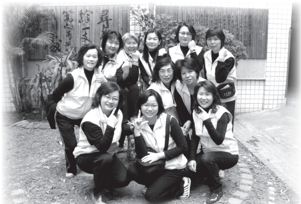
快樂的故事服務隊

故事媽媽常常講故事給我們聽，他們每個星期二都會來教室，曾經講了泥土、地震、星星和寶寶……。他們講的每一個故事都很好聽。我想要說：「謝謝故事媽媽！您的精彩故事，讓我們知道更多知識」。我知道你們沒有領薪水，真的好辛苦，對我們好有愛心，謝謝故事媽媽！