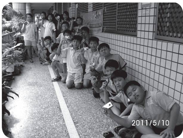
我們是校園植物攝影家

週休二日，我們帶著愉悅的心情來到田尾。沿途種滿各式各樣不同種類的花，有玫瑰花、菊花、劍蘭，不僅鳥語花香，還可以悠閒騎著自行車，迎著微風，哼著輕快的歌曲，自由自在享受田野風光。如果你還惆悵週休二日何處去？走！來一趟田野賞花騎車之旅，包你流連忘返，下次還會再來喔！