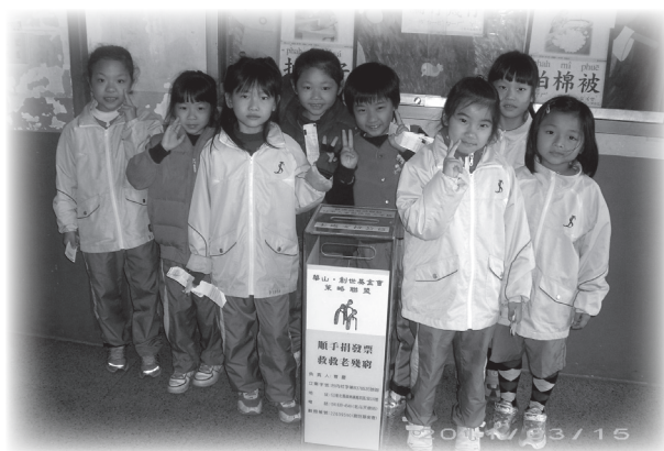
我們都是愛心小天使

「咻！咻！咻！」車水馬龍的十字路口，總有許多車子疾駛而過，讓人提心吊膽，也不禁為那些駕駛人捏把汗。尤其現今交通工具這麼進步，如果大家都貪圖自己方便，不遵守交通規則，那麼害人又害己，所以為了大家的安全，不管行人或駕駛都要記得「馬路如虎口，遊戲危險多」！